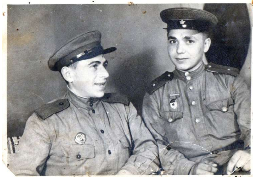
С боевым товарищем (справа)

поэтому, чем ближе была победа, тем выше была наша бдительность, тем сильнее были удары по врагу».