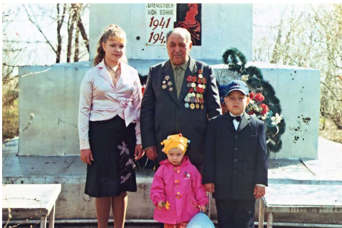
С правнуками у обелиска.

А нашим дорогим ветеранам в годовщину великой Победы хочется пожелать крепкого здоровья, счастья и мирного неба над головой!